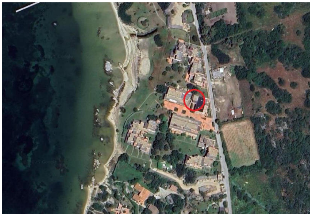
FOTO SATELLITARE CON INQUADRAMENTO TERRITORIALE DEL BENE