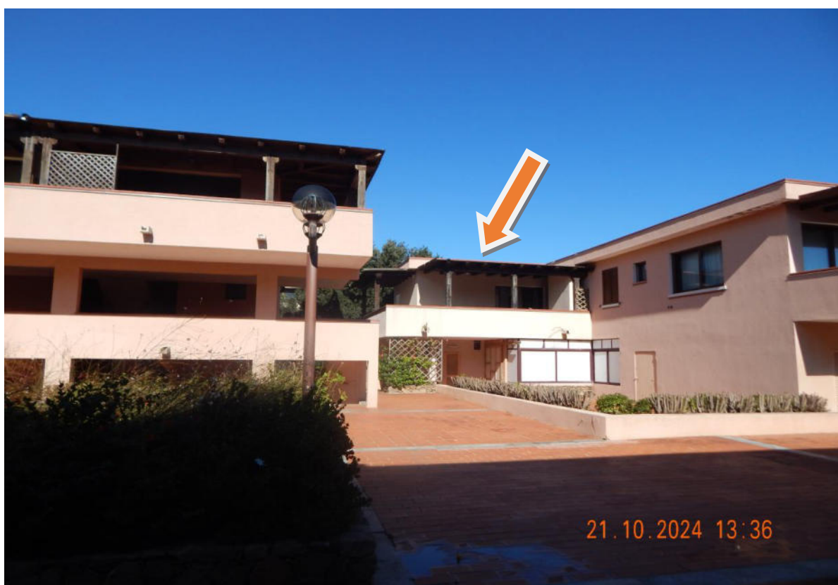
FOTO N° 1 Vista generale del Fabbricato e indicazione dell'Unità Immobiliare, posta al Piano Primo